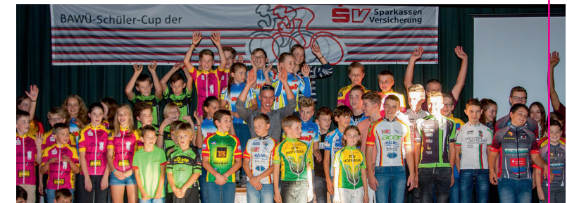
BAWÜ-Schüler-Cup Ehrentag in Hofweier 2018

Die Nachwuchsrennserie des Badischen und Württembergischen Radsportverbandes. Die Top Rennserie in Deutschlands Süden