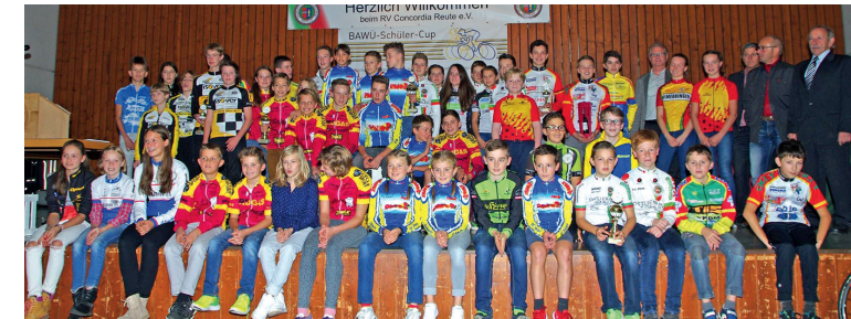
BAWÜ-Schüler-Cup Ehrentag in Reute 2016

Eine Rennserie zur Förderung und Talentsuche junger Radsportlerinnen und Radsportler der lizenzierten Altersklassen U11, U13, U15, Schülerinnen und Schüler sowie die Talentsuche „ERSTER SCHRITT“.